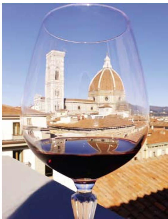
То самое лайкабельное фото с террасы ресторана TOSCA&NINO